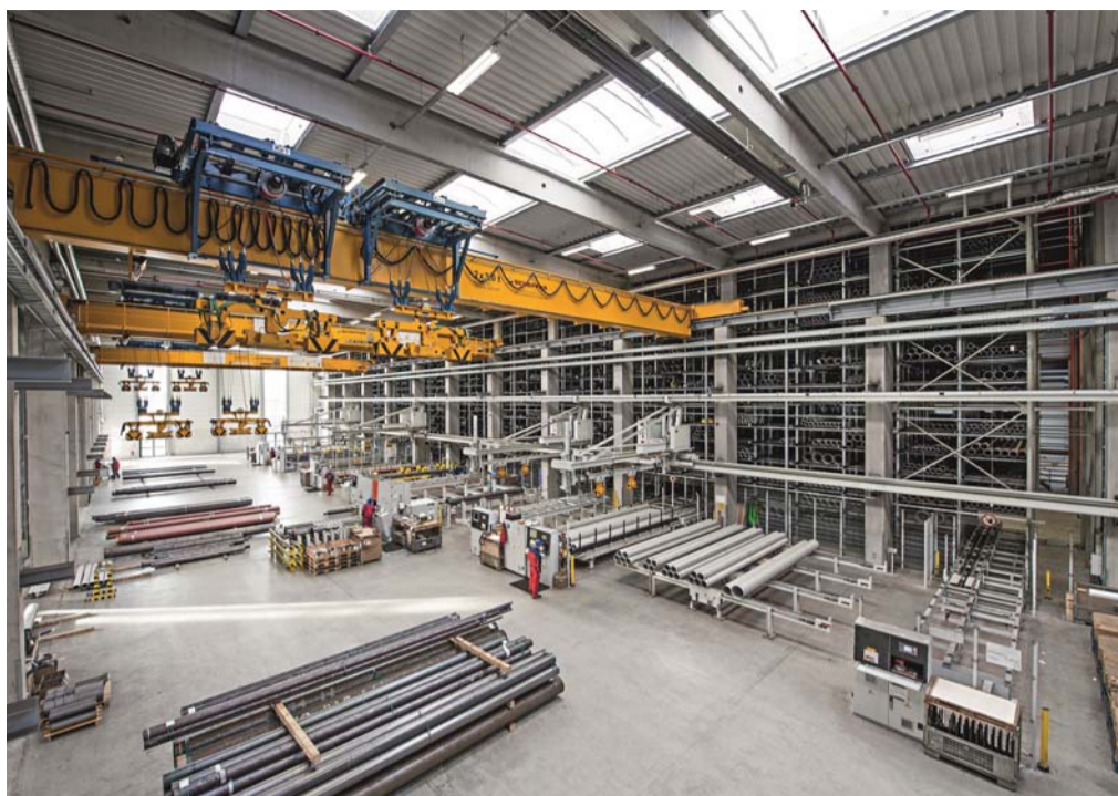
Im Zentrallager Beucha/Leipzig bevorratet rff Rohre aus C-Stahl und rostfreiem Edelstahl.