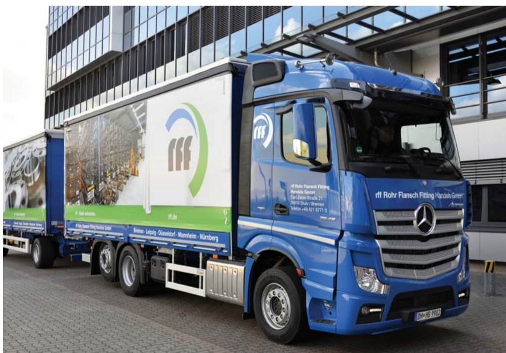
Mit einem modernen Fuhrpark stellt rff den hohen Lieferservice für seine Kunden sicher.