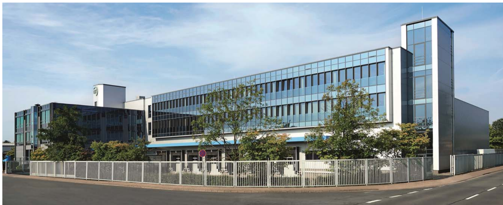
Seit 1976 hat sich rff zu einer festen Größe als Handelshaus für Rohrverbindungen und Rohre entwickelt.

hen. Aus diesem Grund wurde Anfang des Jahres ein EPC-Team (Engineering, Procurement and Construction) am Standort Beucha/Leipzig zusammengestellt. Das Team befasst sich ausschließlich mit den besonderen Anforderungen im Bereich Planung, Beschaffung und Bau komplexer Anlagen. „Das EPC-Team ist Teil unserer strategischen Ausrichtung, wenn es um die optimale Betreuung von Großkunden geht. Heute arbeiten wir mit Konzernen bei der Umsetzung ihrer internationalen Projekte viel enger zusammen als in der Vergangenheit. Zusammen mit der Abteilung „Key-Account-Management und Konzerne“ sind wir in diesem Bereich noch professioneller aufgestellt. Damit bieten wir eine Performance, die nicht viele Marktbegleiter leisten können“ erläutert Alexi.