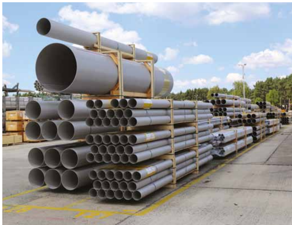
Ein Schwerpunkt der Tätigkeiten in Knesebeck liegt in der Fertigung längsnahtgeschweißter Rohre aus Band und Blech.

Mit BUTTING Könnern (ehemals Sosta) hat die BUTTING Gruppe im Jahr 2017 einen bereits bestehenden Betrieb aus dem Edelstahlrohr-Bereich übernommen. Das Werk in Sachsen-Anhalt umfasst eine Band- sowie eine 6-m- und eine 12-m-Blechrohrfertigung und unterstützt somit insbesondere das Stammwerk in Knesebeck durch die Fertigung von längsnahtgeschweißten Edelstahlrohren vom Band und Blech in zwei bis 12 Meter Längen. In den fünf Fertigungshallen mit einer Produktionsfläche von 17.670 m 2 arbeiten rund 70 Mitarbeiter. Nach der Übernahme hat BUTTING in den letzten vier Jahren kontinuierlich in den Produktionsstandort in Sachsen-Anhalt investiert: Das Managementsystem und die Fertigungsprozesse wurden angepasst und optimiert. Die Mitarbeiter wurden in den Kernkompetenzen Schweißen, Umform- und Werkstofftechnik geschult. Mit Andreas Tietje konnte