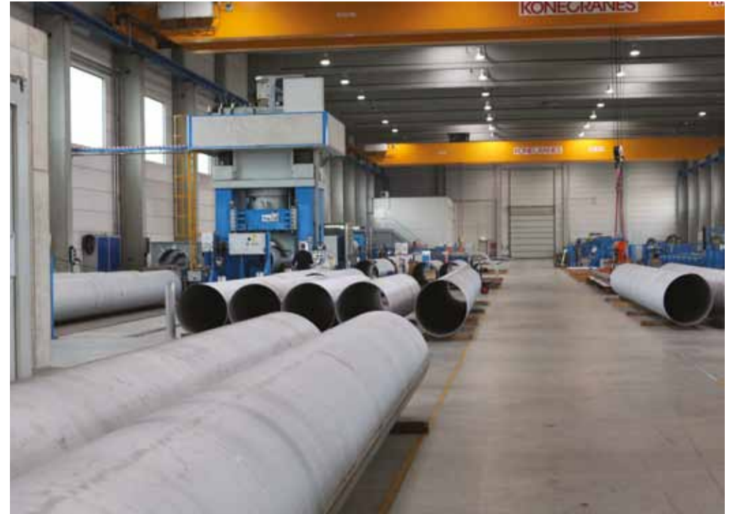
Der Fokus in Könnern liegt auf der Herstellung von Edelstahlrohren: Bandrohre bis DN 600 und Blechrohre bis DN 1.200 mit kleineren bis mittleren Wandstärken.

Die zusätzlichen Kapazitäten des weiteren Produktions-