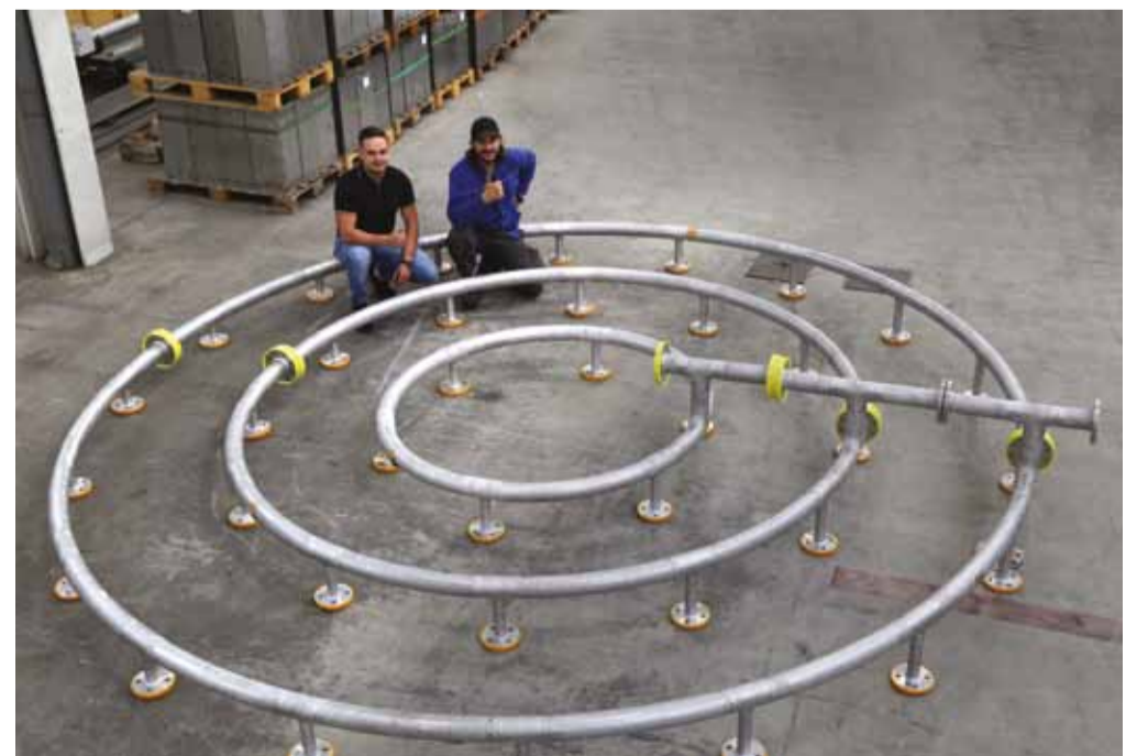
Kurzfristige Lieferung von Schweißkonstruktionen.