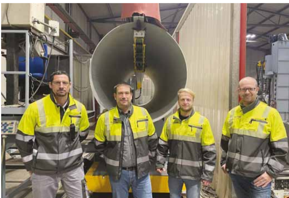
BUTTING Könnern produziert in gewohnter und bewährter BUTTING Qualität.