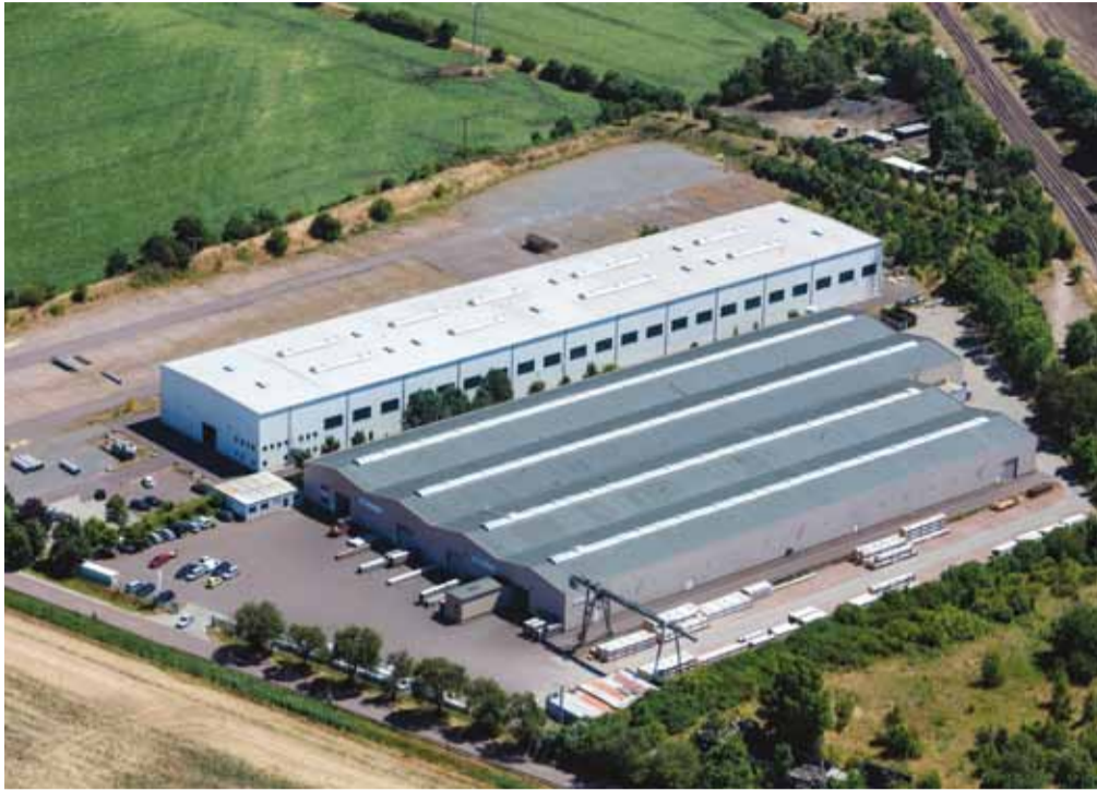
In den letzten vier Jahren hat BUTTING kontinuierlich in den Produktionsstandort in Könnern investiert.

ein QS-erfahrener Mitarbeiter aus Kneesebeck für die Werkleitung in Könnern gewonnen werden. Mit Erfolg: Heute weist das Werk in Könnern die gleiche Organisationsstruktur wie BUTTING in Kneesebeck auf.